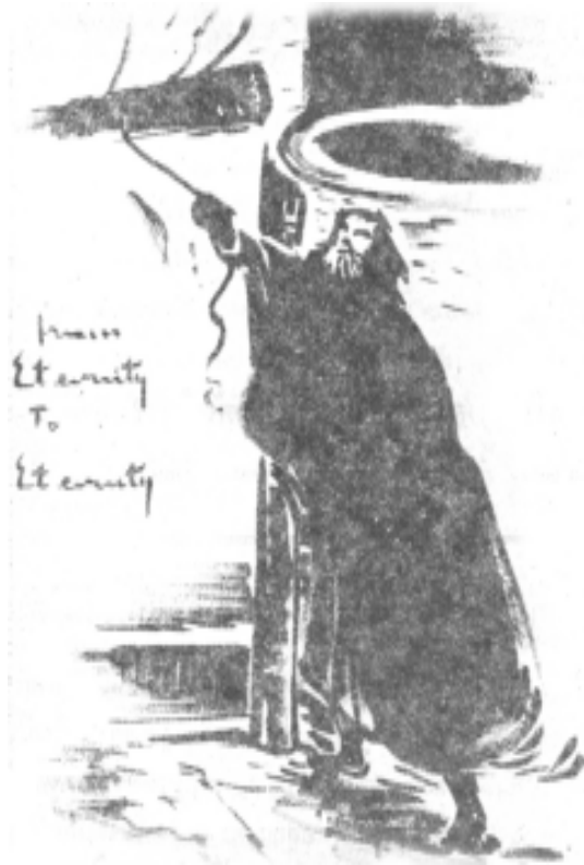
“จากอนันตะสู่ออนันตะ” โดย เอ็มมานูเอล เซอร์แมน