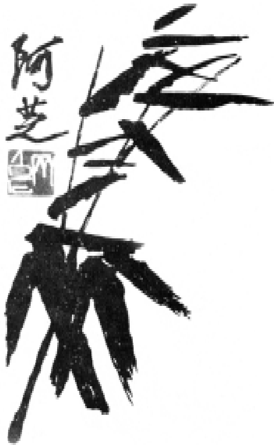
“กิ่งไม้” โดย ชีไป๋ซี