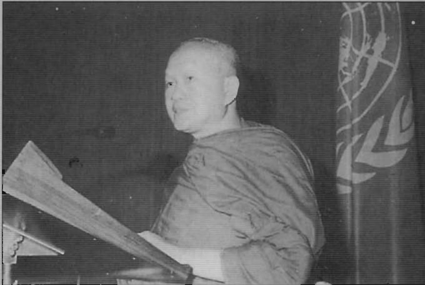
ท่านเจ้าคุณฯ แสดงปาฐกถาในพิธีรับรางวัลการศึกษาเพื่อสันติภาพ (UNESCO Prize for Peace Education) ที่กรุงปารีส ประเทศฝรั่งเศส