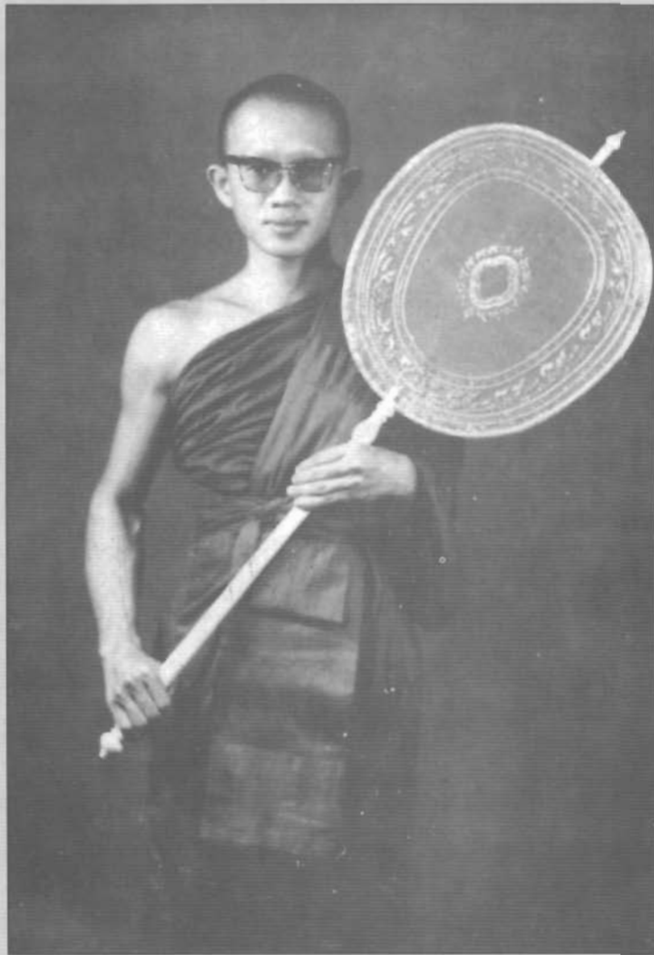
พระมหาประยุทธ์ อารยางกูร เปรียญธรรม ๙ ประโยค