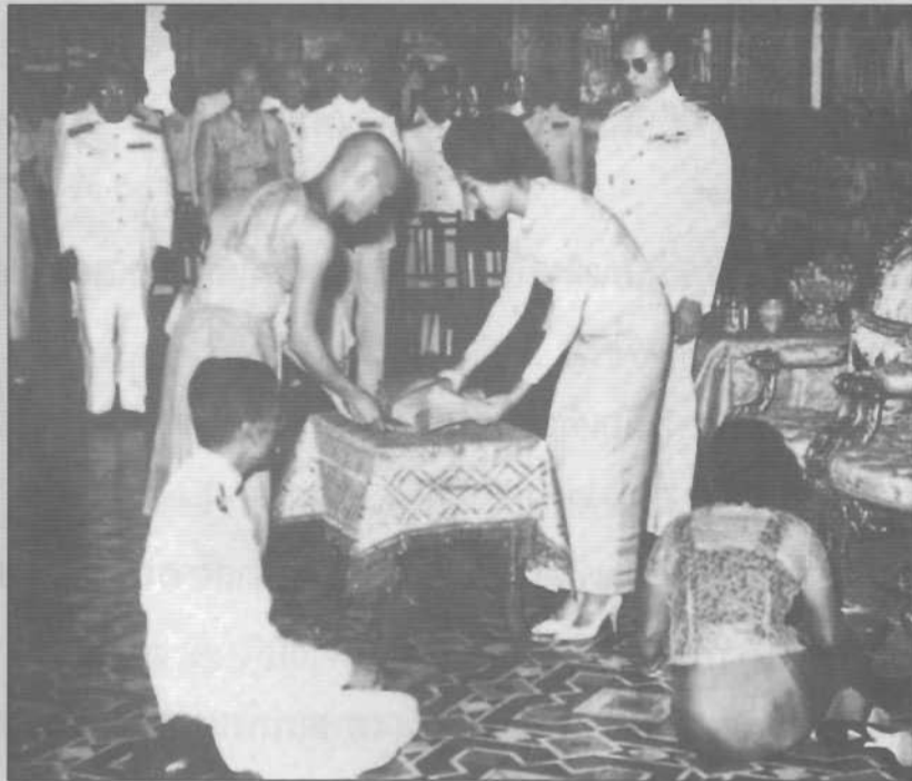
สมเด็จพระนางเจ้า พระบรมราชินีนาถ ทรงประเคนไตรจีวร ในพิธี อุปสมบทนาคหลวงประยุทธ์ อารยางกูร ณ พระอุโบสถ วัดพระศรี รัตนศาสดาราม