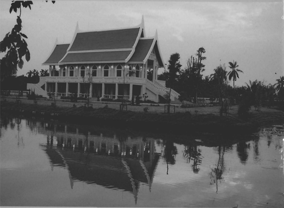
พระอุโบสถ วัดญาณเวศกวัน